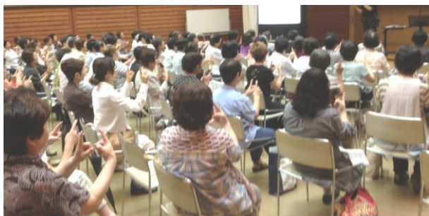
手話と共に『一本の鉛筆』

第1回広島平和音楽祭で「いばらの道が続こうと平和のために我歌わん」のメッセージを残し平和を願う歌として歌われた、美空ひばりさんの「一本の鉛筆」をみんなで歌い、平和について考えます。